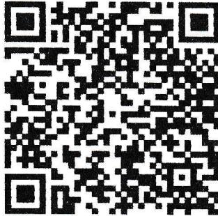
QR Code ส่งคลิปวิดีโอขึ้น

หรือ QR Code ตั้งแต่วันที่ 20 ถึง 31 พฤษภาคม 2567 ประกาศผลผู้เข้ารอบชิงชนะเลิศ วันที่ 2 มิถุนายน 2567