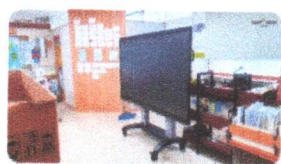
SMART TOUCH 2023 | การติดตั้ง