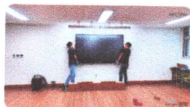
SMART TOUCH 2023 | การติดตั้ง

โรงเรียนมัธยมศึกษา Chungju Technical ประเทศเกาหลีใต้ ได้ติดตั้งหน้าจออัจฉริยะ STS-88IR11 เพื่อใช้สำหรับการเปลี่ยนแปลงการสอนและเพิ่มประสิทธิภาพนักเรียน