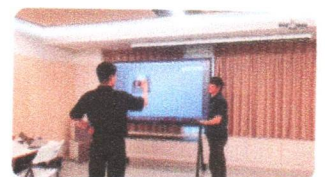
SMART TOUCH 2023 | การติดตั้ง

สถาบันสอนภาษา C&G English ประเทศเกาหลีใต้ ได้ติดตั้งหน้าจออัจฉริยะ STS-88IR11 เพื่อใช้สำหรับการสอนภาษาอังกฤษ