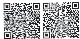
ตัวอย่างภาพ สิ่งที่ส่งมาด้วย

สำนักงานปลัดกระทรวง กลุ่มยุทธศาสตร์การเปลี่ยนแปลง มท. โทร./โทรสาร ๐ ๒๒๒๓ ๔๘๓๘